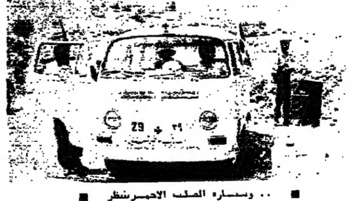
... وسيساره الضرب الأحمر منظر

صيدا منذ من تزيه نقوزي : سنت الطائرات الإسرائيلية أمين ، اعتقد غارات جوية على منطقة كفرشوبا بالمرتوب منذ أيار ١٩٧٠ . وقد دمرت الطائرات الإسرائيلية كسي غاراتها الخمس التي بدأت في الساعة الثامنة صباحا ، محطت ببيسوت كفرشوبا تقيما ككلا ، ولم يبق من منازل البلدة سوى بضعة منازل نسي التي الترتي أصيبت بأضرار جسيمة كما دمرت الطائرات مسجد البلدة ، وأصابت عددا من السيارات وقتلت امرأة وأصابت اثنين بجروح . وقد نجا المواطنون في البلدة الذين تجاوز عددهم أمين مكة مواطنين بأعجوبة بينما كانوا في حقولهم ، عندما بدأت الغارات . فقد قامت الطائرات الإسرائيلية منذ الساعة الثامنة بغارات مكثفة على منطقة كفرشوبا مستطارات استهدفت أولا المناطق المرجية والزراعية المحطة بالبلدة ، وانتهى القصف الأول بعد ظهرين دقيقة . ونحو الساعة الثامنة و٣٥ دقيقة عادت أربع طائرات إسرائيلية مرة ثانية فوق كفرشوبا ، وأغارت بالقتل على وسط البلدة ، وفي أطرافها الشمالية ، فطفت سحب الدخان الأسود البلدة ، واستمر القصف لدة ربع ساعة . ونحو الساعة العاشرة عادت الطائرات لتغير من جديد مسارات كفرشوبا ، حيث قامت بمعايير قصف جديدة من ارتفاعات شاهقة . وقصد شاهدت خلالها من موقع قريب رانسيا النفخ ثلاثة صواريخ « سام - ٧ » تطلق باتجاه إحدى الطائرات التي تركت وراءها دخانا أسود تمل أن تجه داخل الأراضي المحتلة عند قمة الريتا . وتوقف القصف بعد ذلك لدة نصف ساعة ، عادت بعده الطائرات العمدة للاغارة من جديد نحو الساعة الحادية